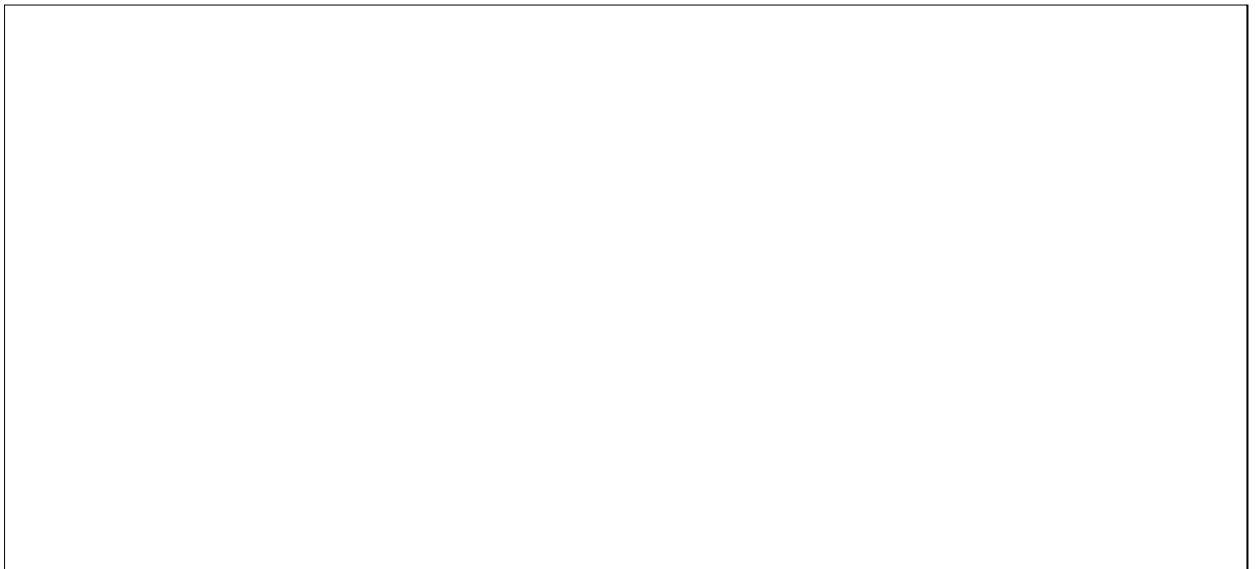
Схема № 1

1.2. Адрес Места (с указанием индекса) [REDACTED].